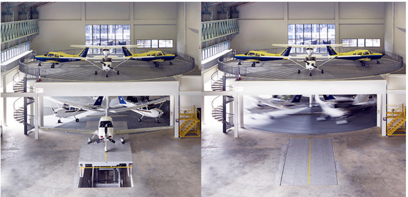
Schätz Carousel Vertical im General Aviation Centre Seletar Airport in Singapur. Das weltweit erste vertikale Flugzeugparksystem wurde 2012 in Betrieb genommen und bietet Platz für 14 Flugzeuge auf nur 450 m 2 Grundfläche.