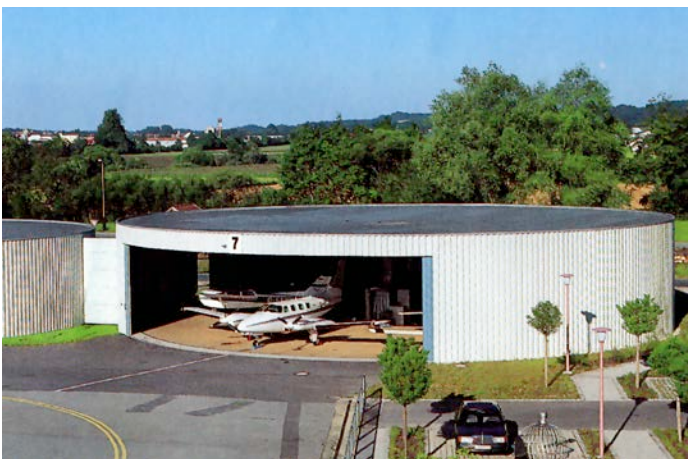
Hangar Nr. 7 am Flugplatz in Eggenfelden, Durchmesser 30m, Aircraft Carousel für MTOW 5,7t mit Tor 1800 / 500 (I-Klasse)