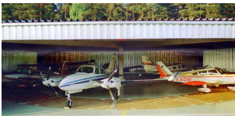
Nachrüstung eines vorhandenen Hangars mit dem flachen Ringcarousel CR 22/16. Die konstruktive Einbauhöhe ist nur 15cm.