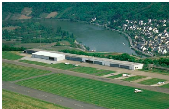
Tuning am Flugplatz Koblenz

Auf vielen Flugplätzen existieren ältere Hallen mit geringer Bautiefe, die in ihrer Substanz in einwandfreiem Zustand sind. Auch diese Anlagen lassen sich sanieren und durch einen torseitigen Hallenanbau mit einem Schätz Aircraft Carousel zu einem modernen Parksystem aufwerten. Als Betreiber, Verein oder Luftfahrt-technischer Betrieb nutzen Sie damit den Bestand und sichern einen rationalen Betriebsablauf. Schätz tuning - eine nachhaltige Investition, die sich schnell bezahlt macht.